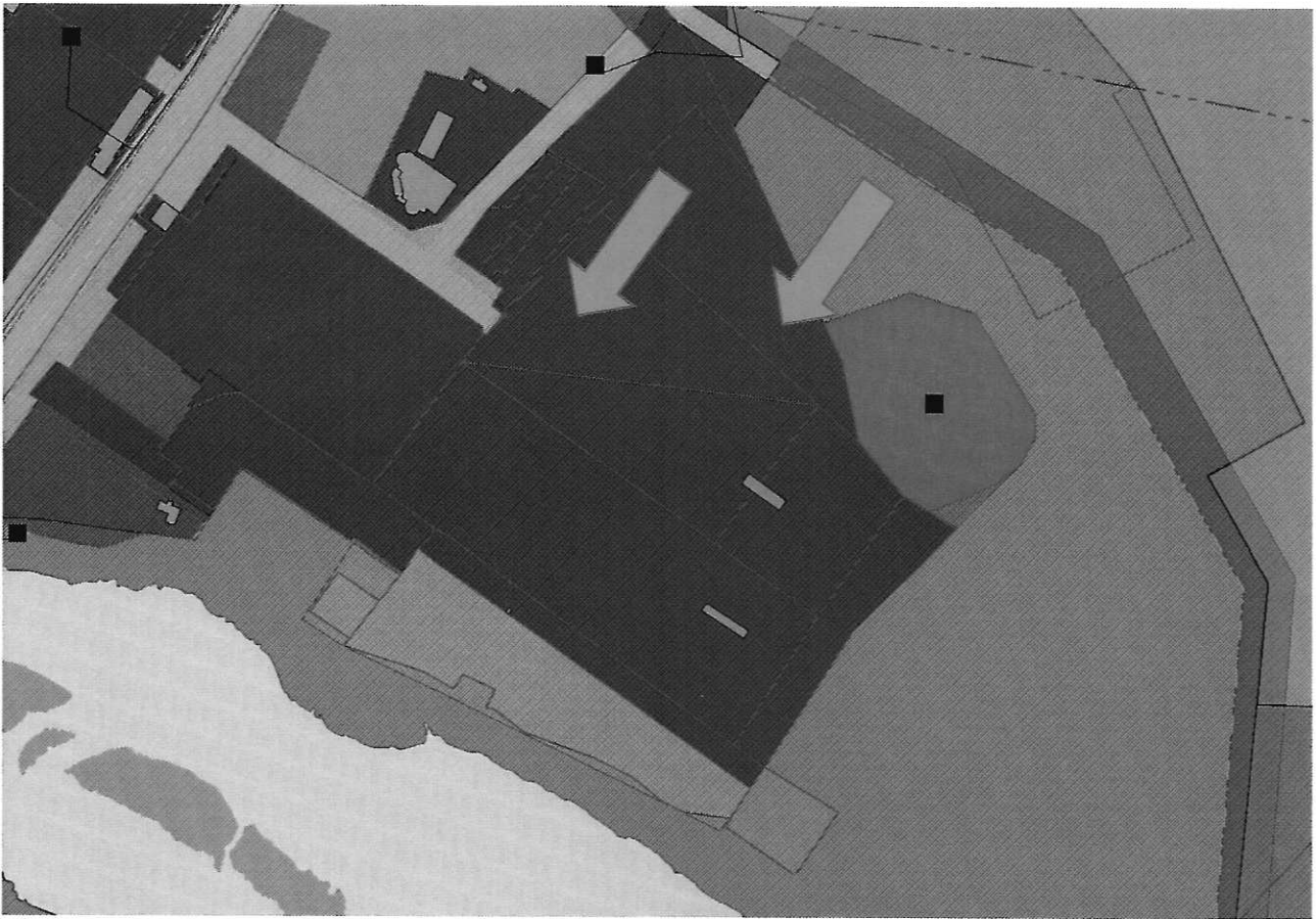
Фрагмент Правил землепользования и застройки АГО