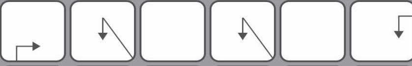
Схема действий Прилипчивый мужик (разг.) Третий снизу период палеозоя Старый Тбилиси Круиз Неестественность в манерах